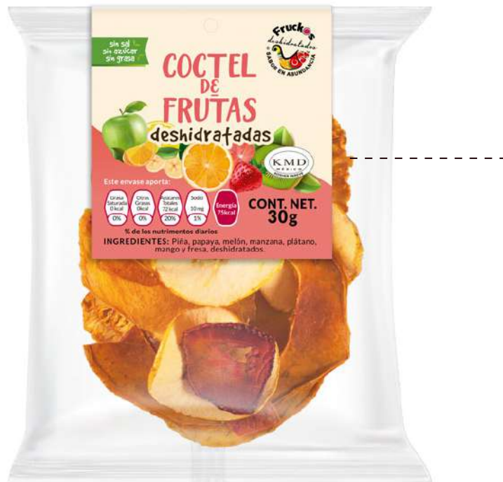
TABLA NUTRIMENTAL CERTIFICADO KOSHER

Todos nuestros productos tienen tabla nutricional y cumplen con los debidos requisitos de salubridad y NOM, además de un certificado KOSHER.